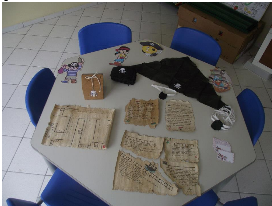
Figura 2: material utilizado na aula

O material utilizado nessa aula consistia em mapas e pistas com folhas de sulfites envelhecidas com borrifador de café; caixa do tesouro feita com a caixinha do Mc Donald's encapada; pirulitos como tesouro; tapa olho e lenço para o cabelo feito em tecido TNT, conforme imagem a seguir: